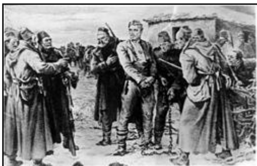
Залавянето на Левски в Къкринското ханче, Художник Никола Кожухаров

А войниците нарязали въжето и раздали на дечурлигата за талисмани. По три гроша за парче. Такъв адет имало.