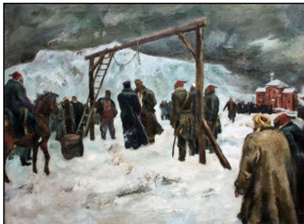
Обесването на Васил Левски, художник Борис Ангелушев