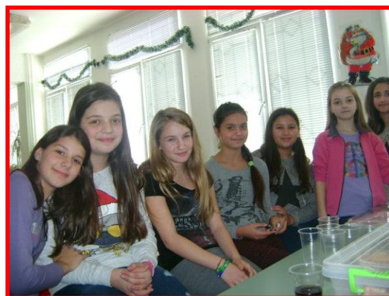
израстване и успех.