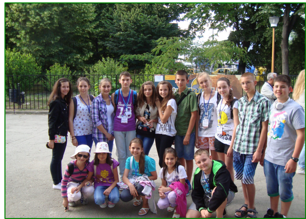
Българските, турските и полските деца

Румънските деца са много възпитани и сърдечни. Въпреки че сградата на училището е само на 6 години, личеше осезателно, че всичко се поддържа много чисто и подредено, като за това основен дял имат самите ученици. Когато другите бяха в час, дежурни ученици излизаха и събираха по двора хвърлени боклуци през междучасието. Направиха ми приятно впечатление зелените алеи в двора на училището, пълни с рози, дървета, храсти. Край тях бяха подредени пейки. Веднага си представих счупените пейки в нашия двор, липсата на дървета и хубави алеи. От моите учители чух, че многото опити да се засади и отгледа растителност в нашето училище, завършват с неуспех, защото от квартала влизат всякакви хора и всичко се изкоренява и чупи. Колко жалко и тъжно е това. Мисля, че е време да се променим и да погледнем на училището като на втори дом за нас, децата.