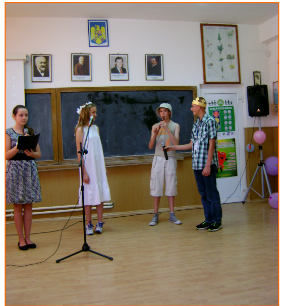
Представителна изява на полските ученици – драматизация по народна приказка