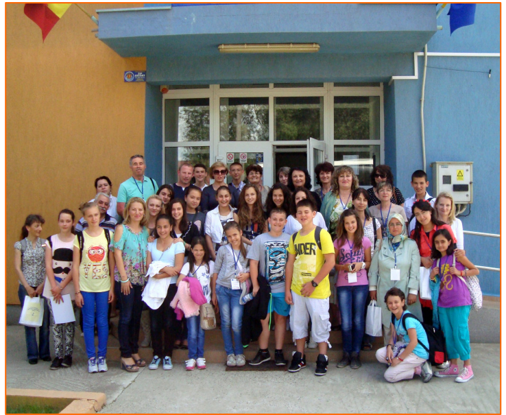
Снимка на всички участници пред училището