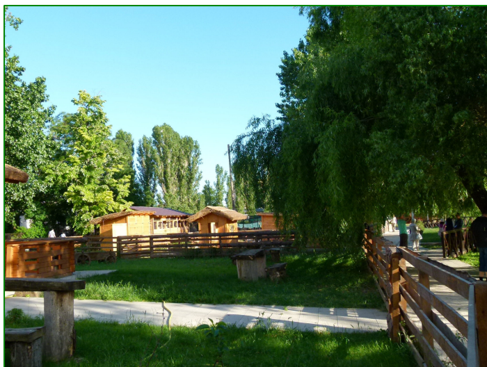
Зелено и красиво