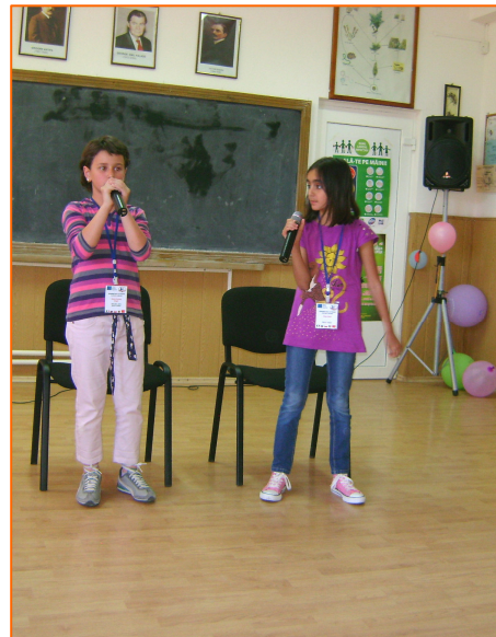
Момичетата от Турция се представиха с индивидуални изпълнения и сценка