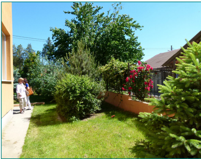
Част от зеления двор на училището