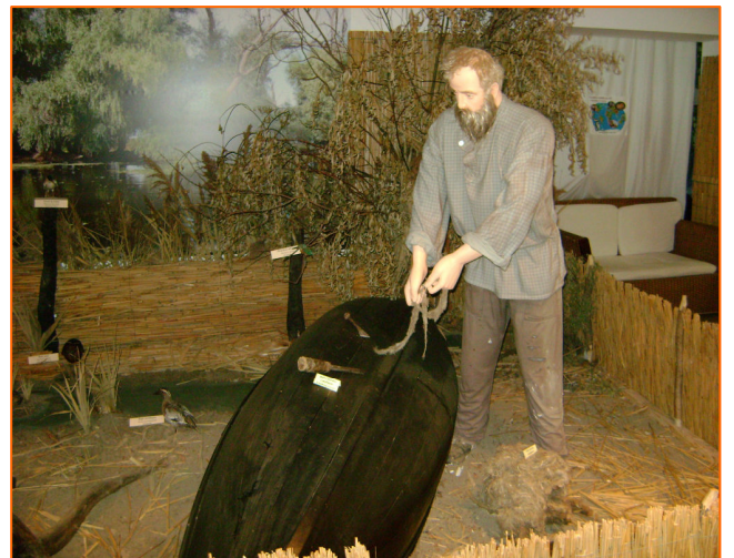
Сцени от бита на тулчани